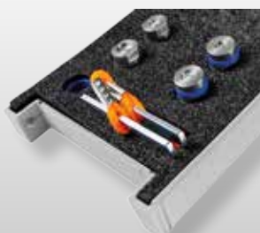
RvKIT UN 2.0 BMW EDITION