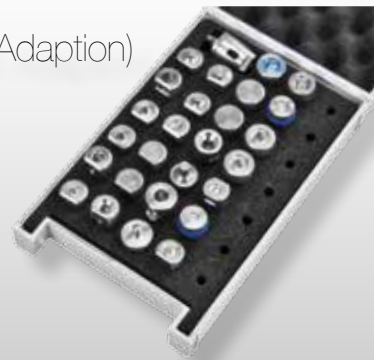
RvKIT UN 2.0 AUDI EDITION