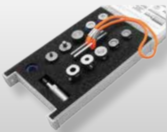
RvKIT UN 2.0

Nietwerkzeuge 60 kN - PNP 90 UN 2.0 & PNP 90 XT 2 (mit Adaption)